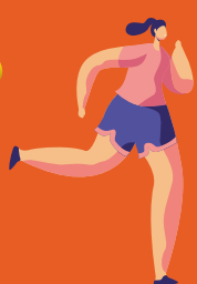
Enseignant-e en activité physique