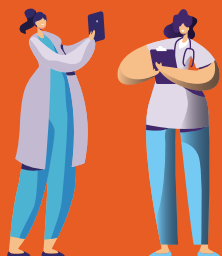
1 ou 2 coordinatrices